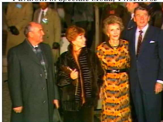
Incontro Reagan Gorbaciov, girato del 18.11.1985